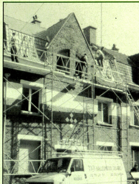
Travaux rue Jean Macé

breuse, vivante se passera dans les meilleures conditions et permettra le développement d'Equipements de proximité, et leur prise en charge par des travailleurs sociaux, animateurs, éducateurs, davantage encore nécessaires.