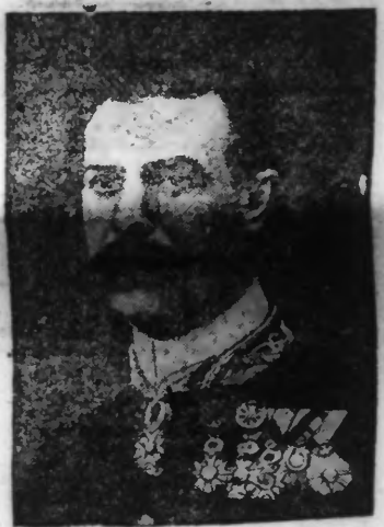
Il fut professeur d'anglais du roi d'Espagne et chef de son secrétariat particulier. Son dernier emploi fut la direction de la section du comencement.