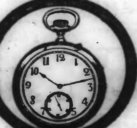
Ce cliché représente le 3/4 de la grandeur de notre montre pour homme.