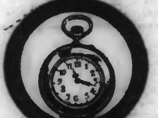
Ce cliché représente les 3/4 de la grandeur naturelle de notre montre pour dame.