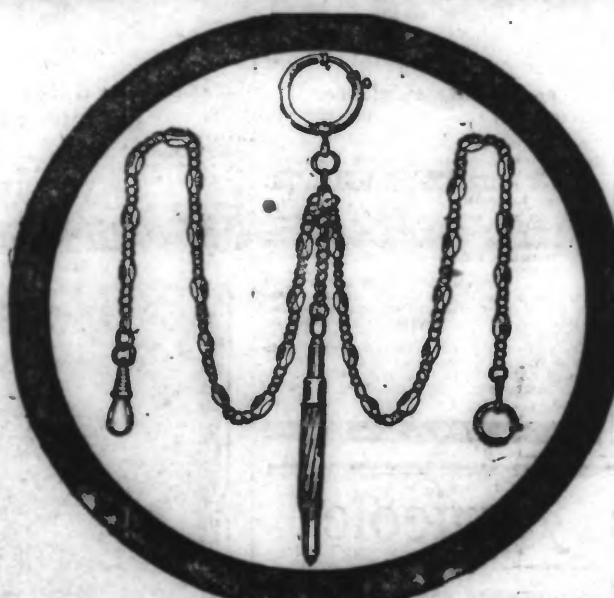
Notre chaîne 'GENTLEMAN' pour homme avec son crayon porte-mines, en notre métal précieux 'ORFIELD' le seul égalant l'or.