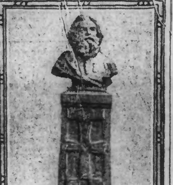
Monument érigé à la mémoire du R. P. de la Croix

C'est samedi qu'a eu lieu, à Poitiers, l'inauguration du monument élevé à la mémoire du savant jésuite et archéologue, le R. P. Camille de la Croix, qui, d'origine belge, passa la plus grande partie de sa vie dans cette ville.