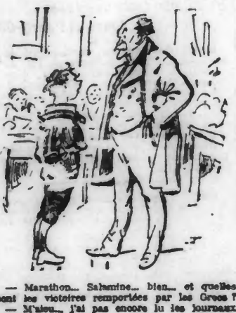
Marathon... Sahmme... bien, et quelles sont les victoires remportées par les Grecs?