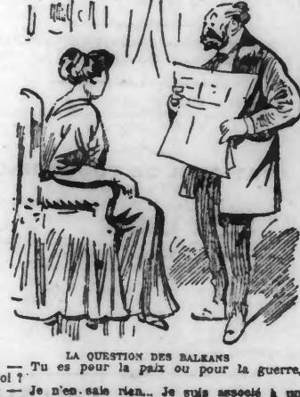
LA QUESTION DES BALKANS... Tu es pour la paix ou pour la guerre?