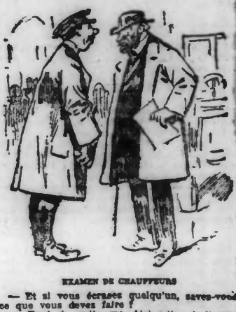
EXAMEN DE CHAUFFEURS... Et si vous écrasez quelqu'un, savez-vous ce que vous devez faire?