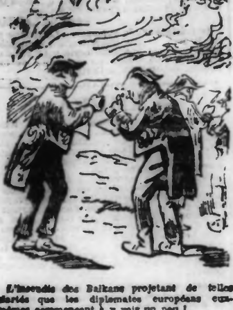
Le monde des Balkans proférant de belles paroles...