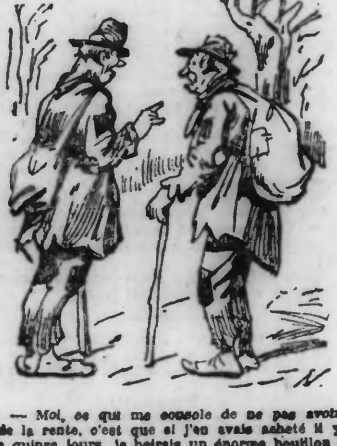
Moi, ce que me consume de ne pas avoir de la rente...