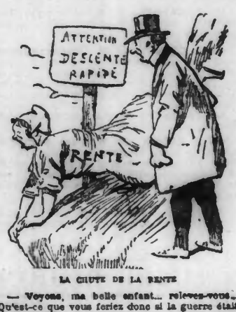
LA CHUTE DE LA RENTE... Voyons, ma belle enfant... relevez-vous...