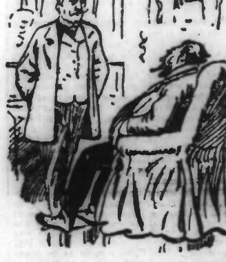
Eh bien, mon déprimé, et ce million de soldats allemands...