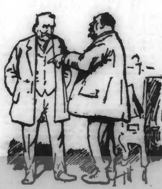
Je prépare un amendement à la loi militaire...