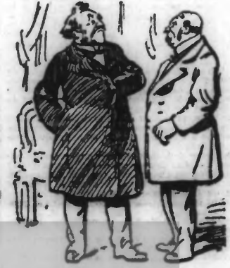
Toute la difficulté consistait, en effet, mon ami...