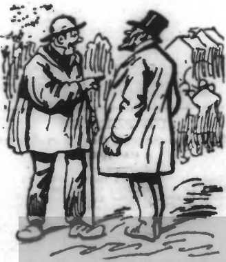
Mais oui, je ne suis pas fâché d'être en vacances...