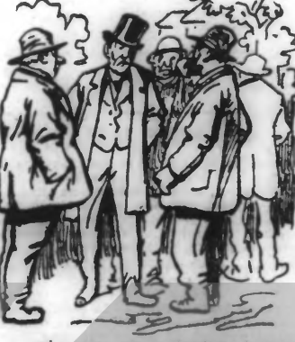
L'opposition entre la Chambre et le Sénat ? Bagnolle...