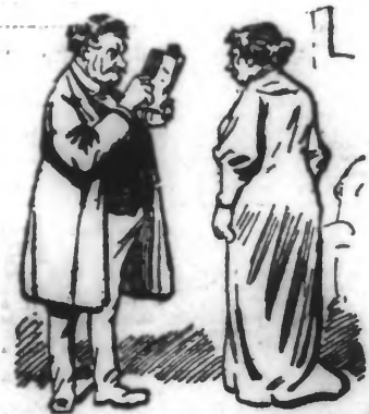
Ce sont les électeurs qui envoient ce livre en qualité de député radical-socialiste...