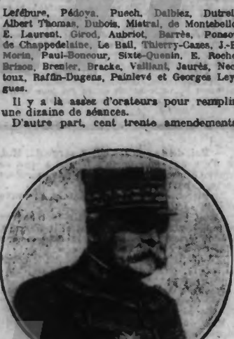
Le général PAU