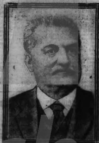
M. ETIENNE, ministre de la Guerre

« Ni maître, ni hôtes, ni domestiques, ne furent épargnés par la lancette du médecin. »