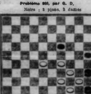
Blancs : 7 pions Les Blancs commencent et gagnent.