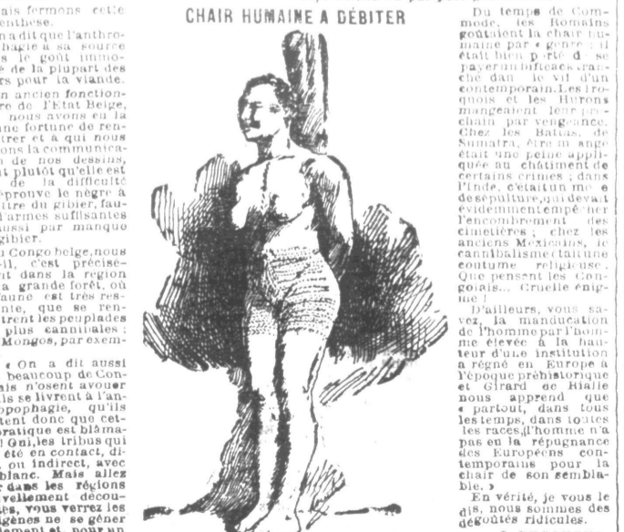
CHAIR HUMAINE A DEBITER

Du temps de Commode, les Romains goûtaient la chair humaine par le sang.