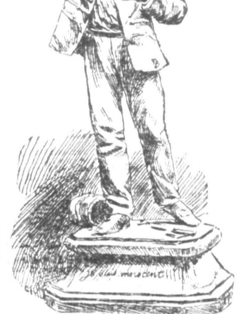
Dans cette collection, la pièce la moins intéressante ne serait certainement pas la lettre statuette qui vous a été envoyée...

Quel est le collectionneur curieux, le bibliophile patient qui arrivera jamais à dresser l'état complet de ce qui a été dessiné, publié sur l'Anglo-saxie « L'Affaire » ?