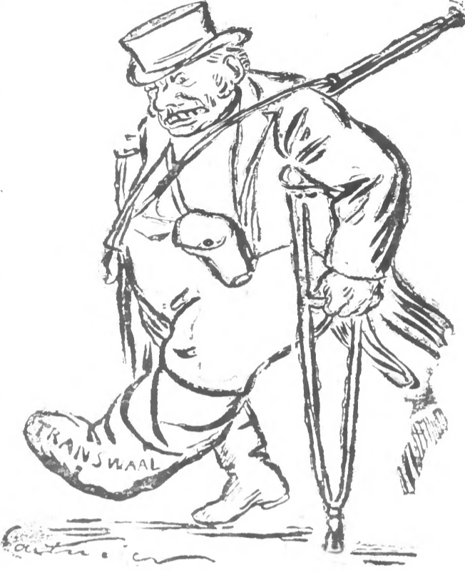
Jon Bull se rend en Chine

Après la conquête du Transvaal, le monde se divise en deux camps. D'un côté, les riches qui veulent garder leurs privilèges et leur domination. De l'autre, les pauvres qui veulent la justice et l'égalité. La lutte est inévitable. Elle se fera dans le sang, si elle n'est évitée par la raison.