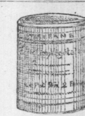
LA MALÉANE OINTION VÉGÉTALE

DONNE DU SANG! Le plus pur et le moins cher des produits similaires. Recommandé par MM. les docteurs aux malades et convalescents. 40 premiers diplômes et médailles. En vente dans toutes les bonnes pharmacies. Pour le gros, s'adresser rue du Faubourg-St-Martin, 116, Paris. Conditions très avantageuses. On accorderait un ou plusieurs dépôts par département, à personnes ou maisons solvables.