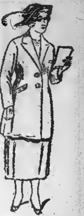
COSTUME TAILLEUR très pratique, en gabardine couleur, façon tailleur, jupe double soie. Le costume... 199 fr. La Maison ACCEPTE les Bons d'Achats de la Reconstitution.

MATELAS LAINE BLANCHE , outil renforcé, belle qualité. Pour 1 lit de 2 personnes... 139 fr. Pour 1 lit de 1 personne... 95 fr. COSTUMES TAILLEUR PRATIQUE en belle serge marine ou noire. Jaque forme tailleur, grande tresse soie, doublée polonoise. HORS COURS... 179.00 PEIGNOIR ROBE D'INTERIEUR belle laçnette rayée, façon soignée, gilet et col marin en shantung naturel. EXCEPTIONNEL. La robe... 33.00 ROBE COUTURE , forme nouvelle en serge pure laine, plissée sur les hanches, manches 3/4, ornée de jolies broderies laine. En marins seulement... 89.00 AU PREMIER ETAGE: ROBES DE 1 re COMMUNION COSTUMES DAMES ET FILLETTES ROBES DE COMMUNION , très belle mousseline anglaise jupe ornée de plis, corsage garni entre-deux Valenciennes, aumônière et ceinture, voile tulle, qualité fine ou mousseline. Façon très soignée. La parure complète... 64.90 ROBE DE LENDEMAN DE COMMUNION , beau satin soie, nuances claires, jupe garnie gros plis, corsage orné de broderies, ceinture drapée. Modèle très élégant, depuis... 89.00 ROBE ELEGANTE POUR FILLETTE en crêpe de ohime, modèle nouveau très gracieux, jupe formée de volants plissés corsage orné de broderie. La robe: 85 c., depuis... 125.00