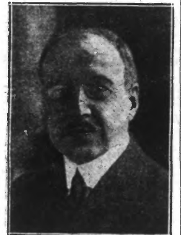
M. REIBEL Ministre des Régions Libérées

Les négociateurs du traité avaient prévu un système de fournitures de machines, de matériaux, d'animaux, etc., mais la procédure était si compliquée, que les sinistrés y ont renoncé, de guerre lasse.