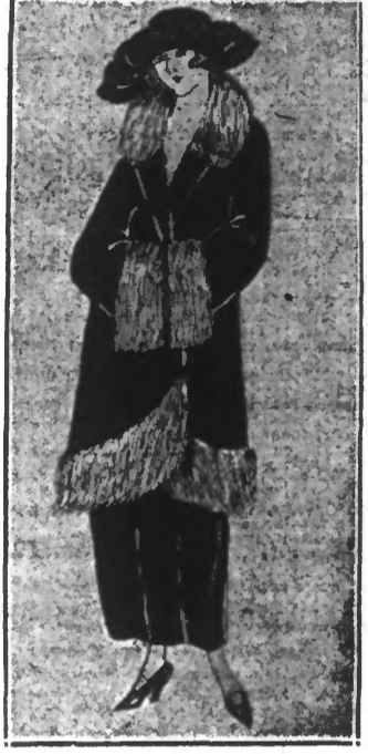
Costume de velours noir garni de renard blanc. Parements « manchons »

demanda Rodolphe en suivant la portière qui retournait à la loge. — Est-ce que je suis, mon digne monsieur ?