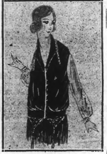
(3) Blouse en velours vieux bien fermant gilet sur un fond en crêpe gris perle

La fantaisie la plus étonnante présida à la coupe de nos blouses, mais en principe, la blouse et la jupe doivent former un tout harmonieux tant par le fond que les détails que par l'assortiment des garnitures : des applications de motifs, découpés ou brodés, posés sur une chemisette rappelleront par exemple la jupe qu'elle accompagnera.