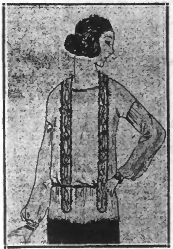
(2) Blouse en lainage vieux rouge. Bandes brodées de noir formant bretelles

gnes années d'existence, reste toujours jeune et désirable ? Qu'elle change de nom ; qu'elle s'appelle casaque ou cassaque, blouse-blette ou chemisette, elle nous charme sans cesse par ses aspects toujours nouveaux et par ses variétés infinies. Il est