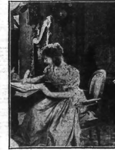
« LA CHOUETTE » GLISSA SA MAIN DROITE DANS SON CABAS POUR POLVOIR SAISIR SON STYLET SANS ETRE VUE.