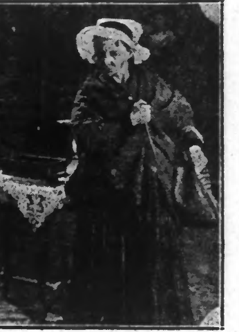
« LA CHOUETTE » GLISSA SA MAIN DROITE DANS SON CABAS POUR POLVOIR SAISIR SON STYLET SANS ETRE VUE.