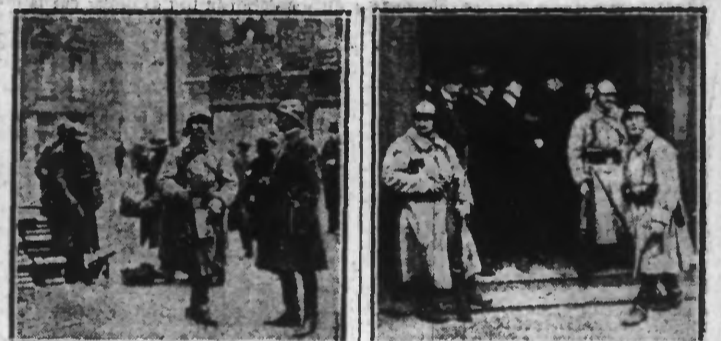
UN POSTE DE MITRAILLEUSE A UN CARREFOUR EN VILLE. UNE USINE GARDEE PAR DES FACTIONNAIRES FRANÇAIS