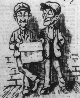
« Ah! voyons un peu s'il y a des nouvelles des copains !... »

« Non c'est la « Gazette des Tribunaux »... »