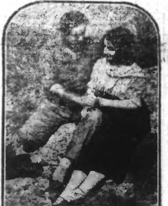
L'AMOUR DANS LE MAQUIS Jean, l'enfant abandonné, et Marguerite Delorba, la fille du Bandit.