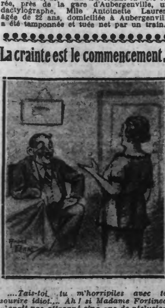
Tais-toi, tu m'horripiles avec ton sourire idiot... Ah! si Madame Fortinque n'avait pas attrapé cinq ans de réclusion