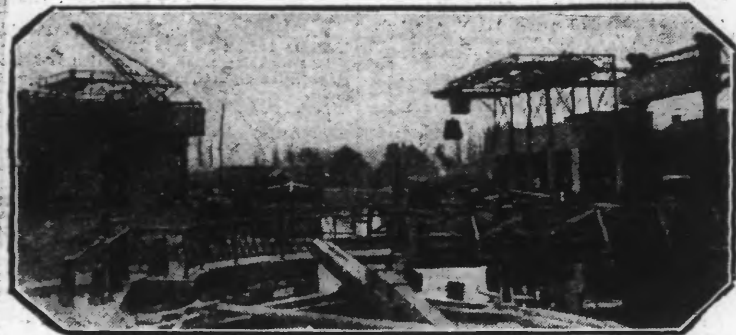
VUE PRINCIPALE DU PONT DU BLANC-SEAU

mentée naturellement; l'autre, de Waguelhal à la frontière belge, est artificiellement par une conduite de 0 m. 70 de diamètre, venant de Lille, en franchissant sans environ 7 kilomètres. L'eau qui arrive par cette conduite vient de l'usine dérivatoire qui la reçoit d'une rigole alimentée par le dessèchement de différents marais de la région. C'est dans le bief supérieur du canal qu'aboutit la conduite et à cette partie du canal, n'ayant aucun rapport industriel, est favorable à la pêche. C'est là que le Syndicat des pêcheurs à la ligne a trouvé son Eden.