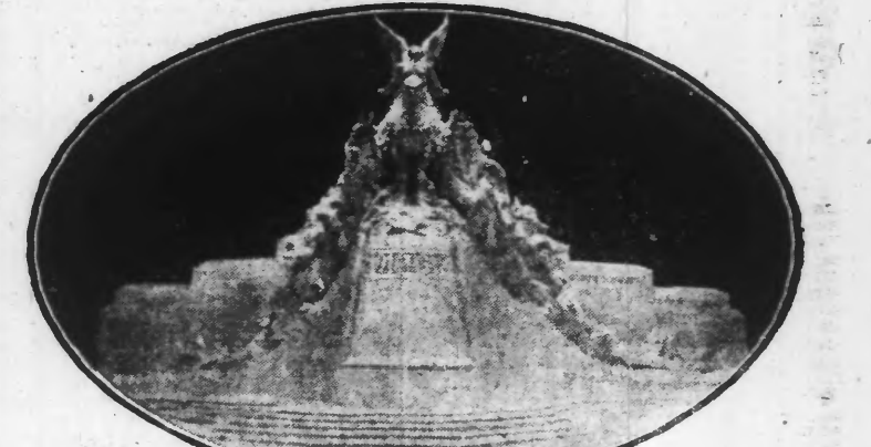
« VERS LA GLOIRE » DE BRASSEUR

Cet avantage est peut-être compensé, malheureusement, par un gros inconvénient : par cela même qu'elles font tableau, elles n'existent vraiment qu'en façade, et l'intérieur du côté postérieur est à peu près nul. Notons d'ailleurs que des cinq projets, celui de M. Terroir est le seul à ne pas tomber dans ce déplorable travers.