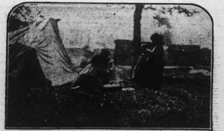
ENFANTS ROMANICHELS FAISANT LA « POPOTE » AU MILIEU DU VILLAGE DE TENTES ET DE BOULOTTES SUR LES REMPARTS DE LILLE

Depuis environ un an, c'est un véritable petit village qui s'est constitué sur les fortifications de Lille entre les portes de Tournai et Louis XIV.