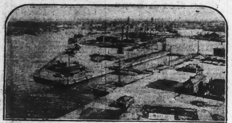
DUNKERQUE - VUE GENERALE DU PORT

Après une longue période de calme, la grande station maritime de la mer du Nord, reprend son activité d'avant-guerre