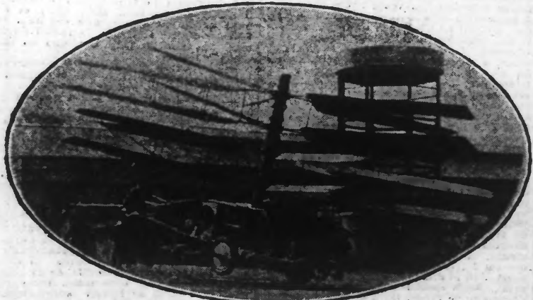
L'HELICOPTERE DE L'AVIATEUR PESCARA

L'aviateur marquis Pescara R. Pescara tenait, à Issy-les-Moulineaux, de s'attribuer les 10.000 francs offerts par l'Aéro-Club de France, au premier hélicoptère qui, partant d'un cercle d'un diamètre de 10 mètres, aura parcouru une distance de 500 mètres, viré et atterri à son point de départ, le tout à une hauteur de un mètre au minimum.