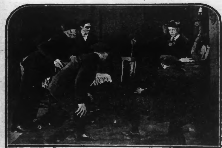
« PATTE DE VELOURS » TENAIT SES ADVERSAIRES EN RESPECT