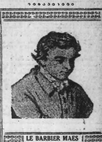
LE BARBIER MAES