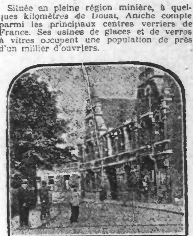
L'HOTEL DU SYNDICAT DE LA VERRERIE D'ANICHE

La belle œuvre mutuelle du Syndicat des ouvriers verriers d'Aniche