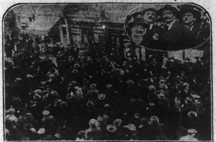
A l'occasion de la venue, hier, à Lille, de M. MALVY, les camelots du roi ont provoqué d'assez violentes bagarres, au cours desquelles cinq agents furent blessés et plusieurs arrestations opérées...