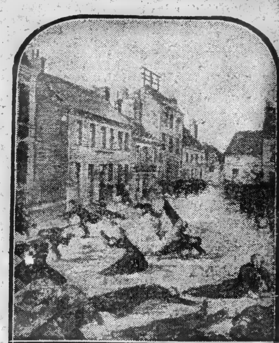
LA FUSILLADE DE 1891