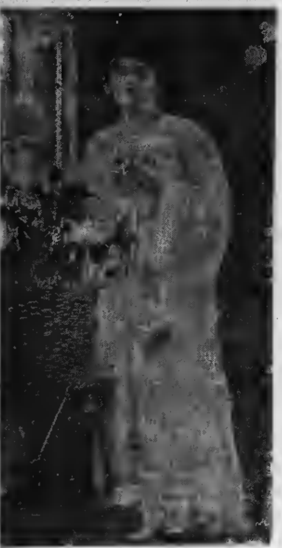
ELLE SENTIT L'ENNUI D'ETRE SEPARÉE DES SIENS