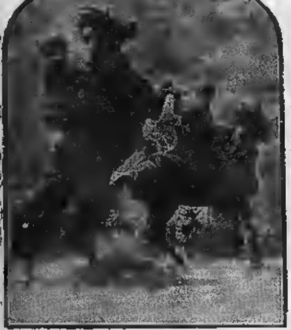
YVONNE FAISAIT CABRER SA MONTURE