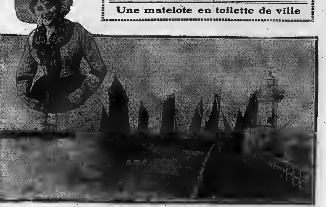
Une matelote en toilette de ville

substitution des filets à mailles de coton parfaitement élastiques, au lieu des anciens filets de chanvre, dont la rigidité déformait, assez aisément, le poisson qui tendait d'y engager sa tête pour passer.