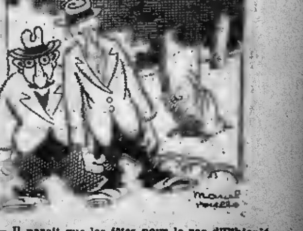
Il paraît que les fêtes pour le ras d'Ethiopia ont été très chat. Comme si il n'y avait pas assez de rongeurs en France, notre pauvre budget, encore faire venir des rats de l'étranger...