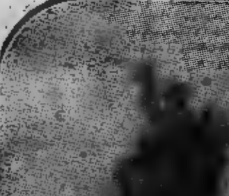
Le monument aux marins et soldats morts pour la Patrie pendant la grande guerre, qui a été inauguré hier à Wattvillies