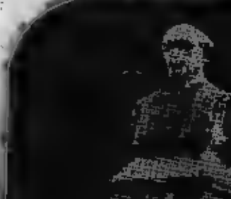
Le monument de Pierre-Joseph Fontaine, inventeur de la cage à parachute des mines, qui a été réinauguré hier à Anzin