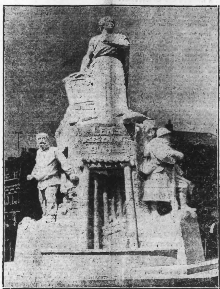
LE MONUMENT AUX MORTS DE LENS

M. HERRIOT PRÉSIDERA LA CÉRÉMONIE D'INAUGURATION DU MONUMENT