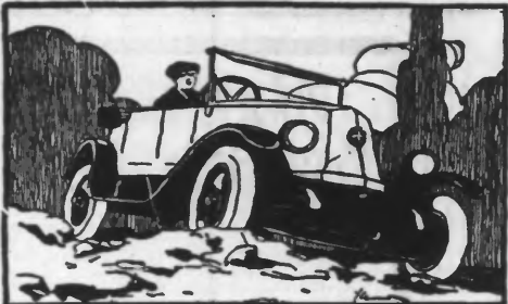
la voiture de l'Agriculteur Torpédo surélévé Prix : 22.700 fr.

avec freins sur roues avant les moins chers à l'usage les plus chers à la revente.