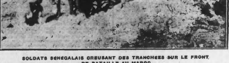
SOLDATS SÉNÉGALAIS CREUSANT DES TRANCHÉES SUR LE FRONT DE BATAILLE AU MAROC

Tanger, 1 er . — Le destroyer anglais « Tourmalin » est arrivé à Tanger. Il restera jusqu'au 15 juillet.