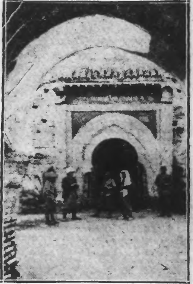
DEVANT LA PORTE DE TALDA

Fez, 2. — Toutes les nouvelles qui parviennent de la région des Djebalis et de celles des Andjars concordent pour laisser prévoir une attaque sur tous les fronts au lendemain de l'Aïd el Kebir et l'arrivée de nombreux contingents rifains est signalée à Chechouan.