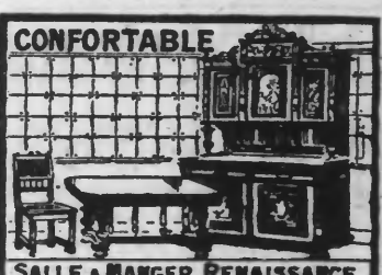
CONFORTABLE SALLE A MANGER RENAISSANCE CHÈNE CIRE Cassini, 1 Buffet 3 Portes en No. 1 Table à allong 6 chaises dessin cur. No 1. Valeur réelle 1750. En Réclame 1275!

Ouvrez tous les jours, même fériés, sauf le Dimanche