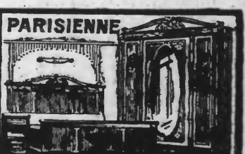
PARISIENNE CHAMBRE MODERNE CHÈNE MASSIF 3 PORTES OUVRANTES Cassini, 1 Armoire 3 Portes, 1 Table de nuit, 1 Lit de milieu No 1. Valeur réelle 1675. En Réclame 1325!

L'examen des modèles ci-contre vous prouvera que nous sommes inimitables comme prix et qualité.