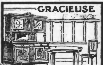
GRACIEUSE SALLE A MANGER LOUIS XVI, CHÈNE PATINE Cassini, 1 Buffet, 1 Armoire, 1 Table ovale 3 allong, 6 chaises cannelées, 6 PARÈTÈRE ASSORTIE 600. Valeur réelle 1850. En Réclame 1465.

Tous nos meubles sont rigoureusement garantis sur facture. Exiger le bon à chaque achat.