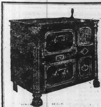
CUISINIÈRES du Nord, tôle glacée forte avec chapelle demi nickelée, longueur 75 c/m.....