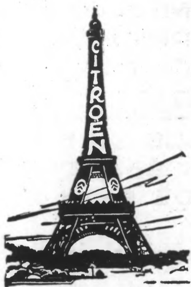
Publicité lumineuse 1925

ont été les innovatrices constantes de l'industrie automobile.