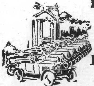
800 voitures d'essai à chaque salon Caravanes en Province 1919-25

1924 La popularisation de l'automobile par la première organisation de vente directe à crédit. La production de 250 voitures par jour est atteinte.