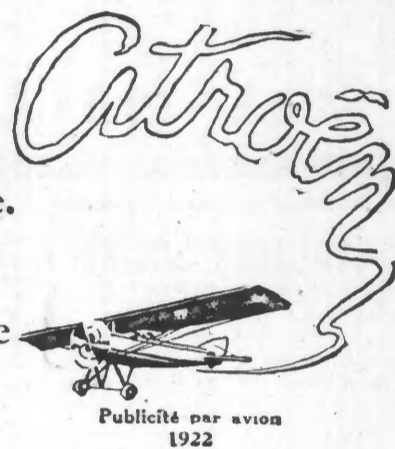
Publicité par avion 1922

1920 La cadence de 100 voitures par jour est pour la première fois atteinte en Europe