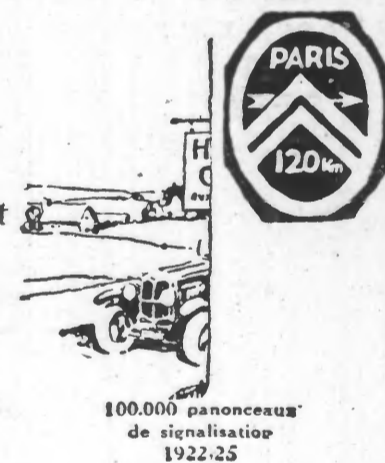
100.000 pancartes de signalisation 1922-25

1923 Première Traversée du Sahara en automobile. Cet évènement marque dans l'histoire le début de l'ère des expéditions africaines en automobile.