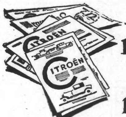
Publicité par pages entières dans la presse 1919-25

1921 Le lancement de Taxis modernes oblige à Paris les Sociétés de Taxis à renouveler leur matériel et abaisse tous les tarifs de Province