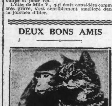
Ce matou et ce chimpanzé ne semblent pas bien s'accorder ?