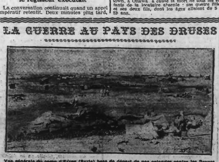
Vue générale du camp d'Irzan (Syrie) lors de départ de nos colonnes contre les Druses