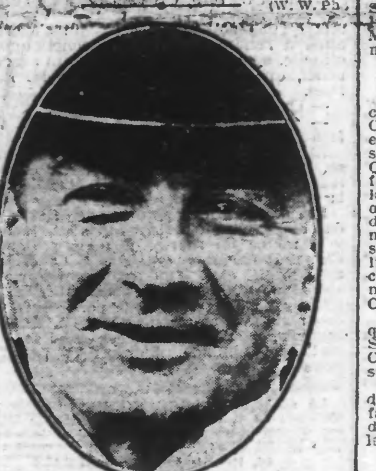
M. BALDWIN, Premier Ministre anglais, contrôleur d'une bombe vient d'être jeté au cours d'un banquet On sait qu'heureusement cet attentat n'a fait aucune victime.

Un évadé de la prison militaire de Lille arrêté à Mouscron. Pour abus de confiance en réquisition, un arrêté en gare de Mouscron, le jeune lieutenant militaire de Mouscron, qui s'était évadé de la prison militaire de Lille, a été arrêté à Mouscron.