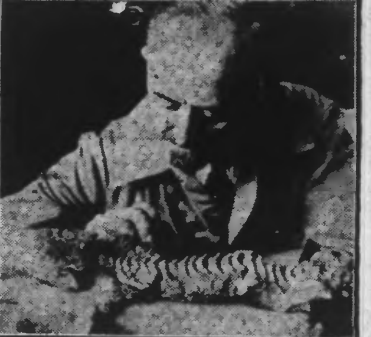
Le « Seymouria Baylensis » est le fossile d'un animal estimé par les géologues comme datant de plus de 15.000 ans.