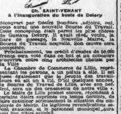
Ch. SAINT-VENANT à l'inauguration du buste de Delory

CNUUDE, présente d'abord les organisations syndicales. Vous savez, dit-il ensuite, ce que veulent les ouvriers, l'amélioration indispensable de leur condition sociale, ils désirent voir s'ériger une nouvelle Bourse du Travail, où ils pourront s'instruire par des conférences, qui nous rend le Delory de la rue de la Vignette.