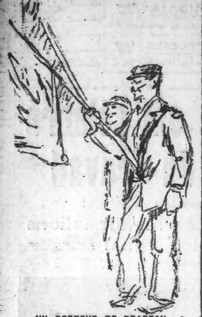
UN PORTEUR DE DRAPEAU

Il n'est plus, et cependant ses convives, ses amis, ses collaborateurs, qu'il a formés continuent son œuvre, l'œuvre qui lui fut chère : l'émancipation du Peuple.