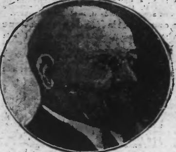
M. HUDÉLO, préfet du Nord

La journée d'hier restera longtemps dans le souvenir des défenseurs et des amis de l'école laïque, ce fut une belle et reconfortante manifestation, en même temps qu'une éloquente réplique aux détracteurs de l'école laïque qui ont pu constater combien grandes sont la force, la foi et le courage des amicalistes. Dès 9 heures, une grande animation régnait dans les rues de Wavrin et par petits groupes des habitants du pays et des visiteurs gagnaient les rues à pied et les autres en auto: le cimetière de Fourmes, à 9 h. 20, de nombreux amicalistes, les élèves du pensionnat Gombert et de nombreux amis venaient s'inscrire devant la tombe de M. Gombert. Après de la tombe se tenait tout d'honneur du sénateur POTIE et le vice-président d'honneur, de M. DEREUSE, conseiller d'arrondissement. Ce qui est adopté à l'unanimité. La lecture du projet de statuts. On procède ensuite à la lecture du projet de Statuts de la nouvelle Fédération intercantonale. Un long débat a lieu. M. PINCHART voudrait que l'on crût d'abord une Fédération cantonale. M. VERCOUTRE-GOMBERT répond que le thème contraire appuyé par M. DEREUSE, conseiller d'arrondissement et par M. BETREMIEUX,