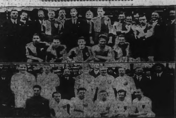
En haut: L'ÉQUIPE DU COMTE DE KENT. - En bas: L'ÉQUIPE DE LA LIGUE DU NORD

(Lire en « Journée Sportive » le compte-rendu détaillé du MATCH NUL)