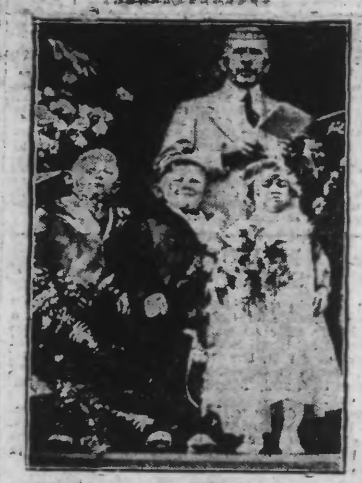
Le mariage de mains vient d'être célébré en Géorgie