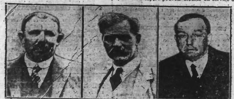
LES GRANDS CHEFS DU MOUVEMENT OUVRIER ANGLAIS. A GAUCHE : J. H. Thomas, ancien ministre travailliste, chef de l'Union Nationale des Cheminots. — AU MILIEU : Ramsay MacDonald, ancien ministre, leader du parti travailliste anglais. — A DROITE : Arthur Henderson, leader du parti travailliste.

Mardi, on annonçait dans les milieux politiques que 4 millions d'ouvriers avaient cessé le travail. On calcule d'autre part que la grève coûte environ deux milliards par jour à l'Angleterre et un important industriel de ce pays, interviewé par un de nos confrères parisiens a déclaré : « Si la lutte se poursuit jusqu'à ses dernières limites, quinze jours — l'Angleterre sortira de là ap-