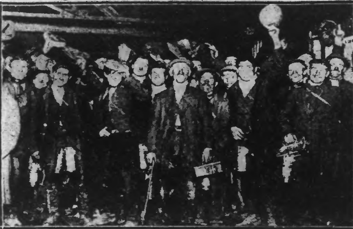
A LA DECLARATION DE LA GREVE GENERALE. LES MINEURS ANGLAIS REMONTANT DES FOSSES SALUERENT L'EVENEMENT (W.W. P.).

Elle menace d'être énorme tant en France, qu'en Belgique et en Allemagne