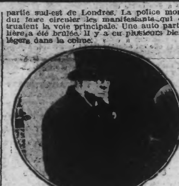
M. WINSTON CHURCHILL, Chancelier de l'Échiquier, photographié jeudi, n'avait pas l'air content.

partie sud-est de Londres. La police montée dut faire circuler les manifestants qui obstruaient la voie principale. Une auto particulière a été brûlée. Il y a eu plusieurs blessés légers dans la cohue.