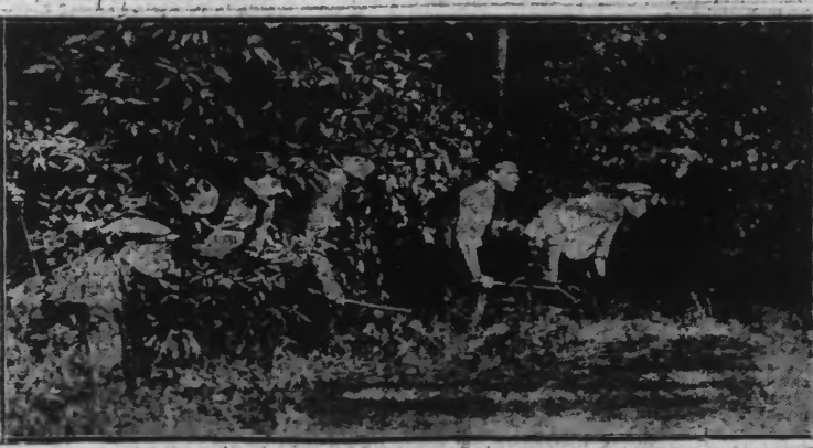
« PORTEURS A DOS » PRÊTS A PASSER LA FRONTIÈRE

Queries-vous prétendre, nous a-t-on demandé que nous arriverions, dans un avenir plus ou moins éloigné, à compter le millième automobile de fraude ?