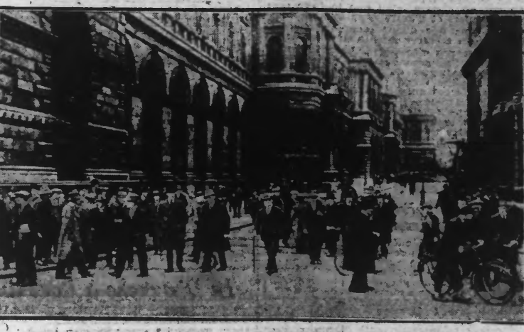
DOWNING STREET LA RUE LA PLUS FREQUENTÉE DE LONDRES, GARDEE PAR LES POLICEMEN EN UNIFORME ET EN CIVIL.