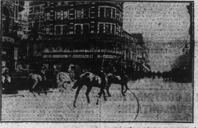
Mais lorsque des manifestations de ce genre se produisent les policiers à cheval armés de gourdins, ne tardent pas à arriver sur les lieux, pour disperser la foule.

I. certaines marchandises dans les magasins. La Gazette Britannique, de lundi matin, dans son édition officielle, dit que des tentatives ont été faites pour arrêter un parti sur la route allant de Londres à Thames-Haven. Des pierres et des bouteilles ont été lancées, mais des renforts importants sont maintenant disponibles et la route sera, dorénavant, bien gardée. Thames-Haven est le plus grand dépôt de pétrole et essence qui existe en Grande-Bretagne et se trouve situé sur la rive nord de la Tamise, avant d'arriver dans aux docks de Tilbury.