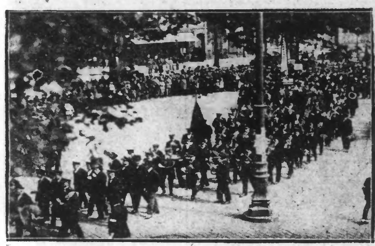
Les Sociétés quittant le Boulevard des Ecoles pour le défilé à travers la ville

Elles groupèrent Dimanche, plus de treize mille musiciens en la capitale des Flandres