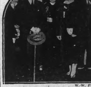
LE ROI ET LA REINE D'ESPAGNE

M. Robert de Fiers, de l'Académie française, relate l'entretien qu'il a eu dimanche avec le Roi d'Espagne. Le souverain lui a dit notamment : « Nous, nous nous en sommes rendus compte, la certitude que la France se relèvera ».