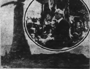
C'est par un temps magnifique que se sont déroulées les grandes fêtes données à l'occasion de l'inauguration du monument commémoratif franco-américain, érigé à St-Nazaire.

Le monument est dû au ciseau d'une artiste américaine, grande amie de la France. Mrs Withensy. Sur un très haut piédestal, imitant un roc et qui se dresse sur des masses dominantes les plus hautes mers, un aigle est posé, se cramponnant de ses puissantes serres. Un guerrier américain le domine, casqué d'acier, les bras tendus, dans sa main droite se trouve une épée, pointe baissée, qu'il offre à la France.