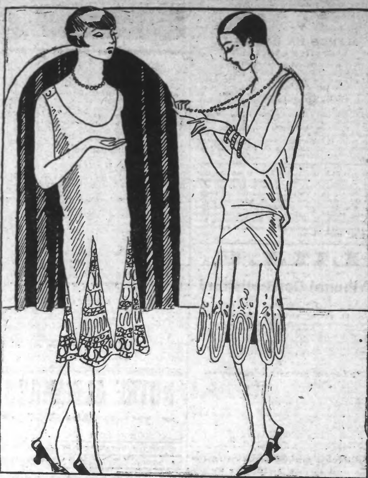
ROBE de crêpe Georgette blond. Pointes incrustées dans le bas de la robe brodées vieill or. ROBE de mousseline de soie blanche, brodée acier.

Avis aux Lectrices Les patrons de la PAGE FEMININE sont soigneusement étudiés et choisis parmi les modèles les plus nouveaux de la mode. Simples et élégants, ils sont d'une exécution facile. Ces patrons existent dans la taille de vos facilités de modification.